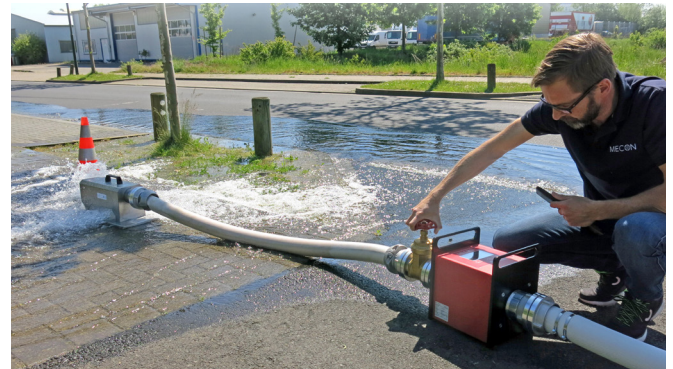
1) Vorbereitung für separate Trübungsmessung HTL TE/TU