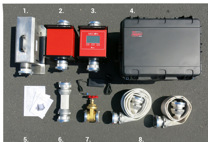
Abbildung zeigt in Storz B (DN 80) Ausführung: